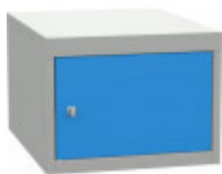
SK43510 Dílenský podvěsný kontejner