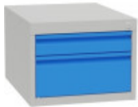
SK43520 Dílenský podvěsný kontejner