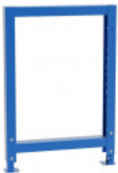
S32100100 Noha pro dílenské stoly - přestavitelná