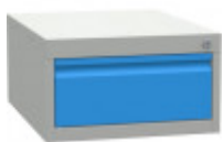
SK42210 Container hängend