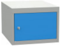
SK43510 Container hängend