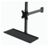
XP2581000 Traverse für Lampe und Werkzeuge 1200