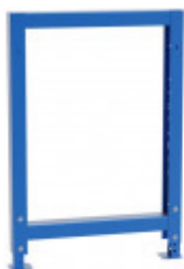
S32100100 pieds d'établis réglable en hauteur