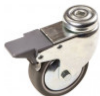
S7001014 jeu de 4 roulettes pour tables d'atelier