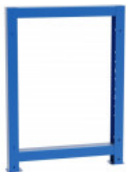
S04102030 pieds d'établis solid