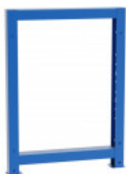
S04102030 pieds d'établis solid